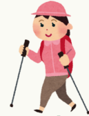
Wanderer mit Stock