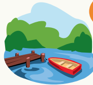
See / Gewässer