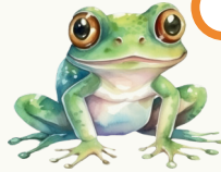
Frosch / Kröte