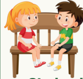
Sitzbank / Panoramaliege